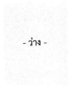
ผู้จัดการสถานธนาอนุบาล