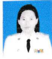
นางสาวฐิติพร เชี่ยวพัทธยากร ประธานสภาเทศบาล